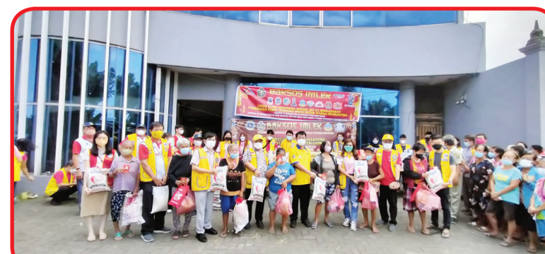
Pimpinan Lions Club Medan secara simbolis menyerahkan hadiah Imlek kepada warga masyarakat.