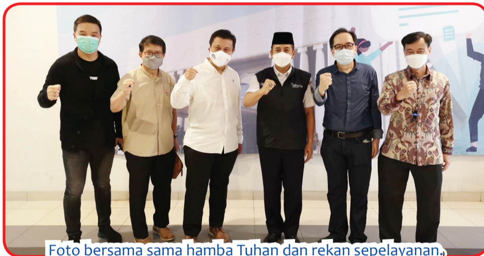
Foto bersama sama hamba Tuhan dan rekan sepelayanan.