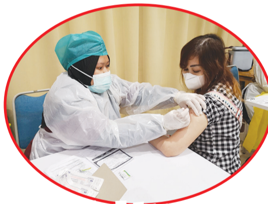
Petugas kesehatan memberikan vaksin booster ke peserta vaksinasi.

Yayasan Hidup Baru juga melakukan vaksinasi booster bekerja sama dengan GKY Pluit, Senin (24/1) untuk melayani Jemaat GKY Pluit, GKY PIK dan GKY Teluk Gong yang disebut Wilayah 1.